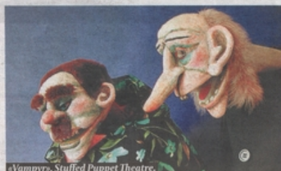
«Vampyr, Stuffed Puppet Theatre.