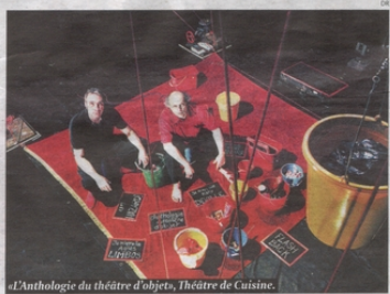
«Anthologie du théâtre d'objets, Théâtre de Cuisine.

Théâtre de la Poudrière, quai Philippe-Godet 22 à Neuchâtel et autres lieux. Tous les jours du 2 au 11 novembre. (Rens. 032/724 65 19, www.festival-marionnettes.ch).