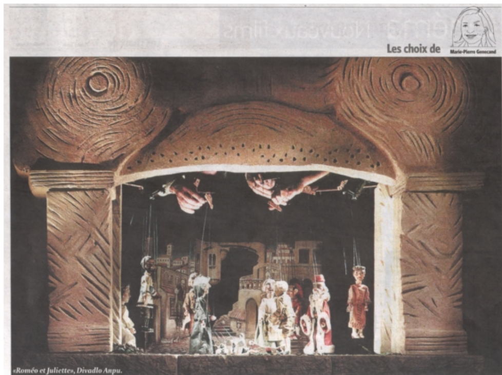
«Roméo et Juliette», Divadlo Anpu.